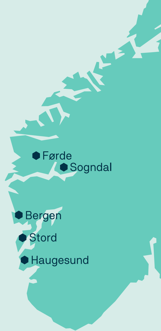
Figur 2: Campus (studentar og årsverk pr. november 2021)