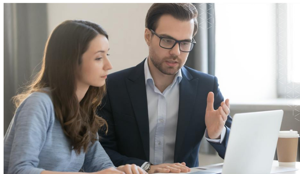
Høgskulen utviklar nytt opplæringsprogram for rettleiarar til ph.d.-kandidatar.