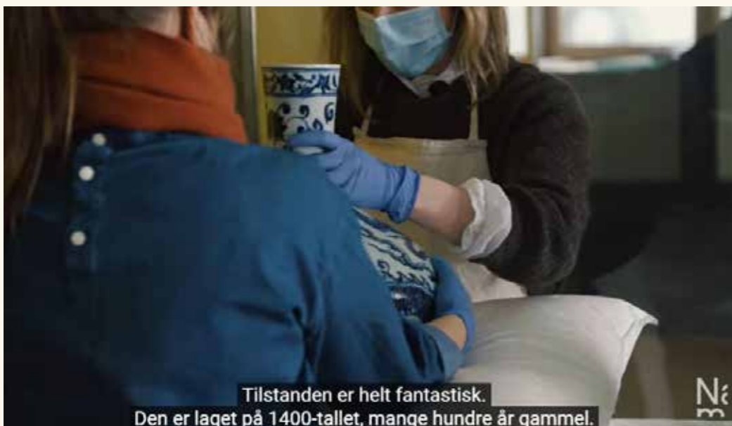
Fra «Kunsten å flytte».

Nasjonalmuseet.no hadde i 2022 en økning i trafikken på 79 prosent, fra 1 040 000 økter i 2021 til 1 869 000 økter i 2022. På Instagram og Facebook hadde museet totalt 140 000 følgere ved utgangen av 2022, en økning på seks prosent fra året før. Antall visninger på YouTube økte med 14 prosent, og telte totalt 574 000.