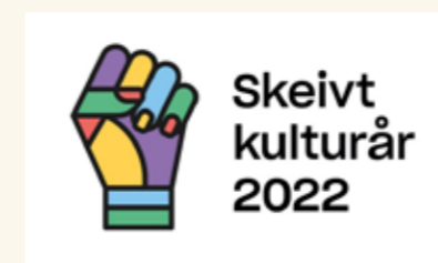
Logoen for Skeivt kulturår 2022.

Nasjonalmuseet opprettet et eget prosjekt som i 2022 gjennomførte en rekke aktiviteter. Sammen med Nasjonalbiblioteket og Skeivt arkiv arrangerte museet markeringen av avkriminaliseringsdagen 21. april. I løpet av våren ble både podkasten Brytning og filmvisningsserien «Motstrøms» lansert. På høsten ble «Ballroom Weekend» avholdt med deltakere fra hele Europa, og filmhelgen «My voice you can't hear/Den stemmen du ikke vil høre» ble gjennomført i samarbeid med Transcultural Arts Production (TrAP).