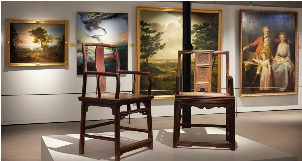
Galleri Østfløyen åpnet for publikum 30. september med utstillingen «Kunstsamlerne».