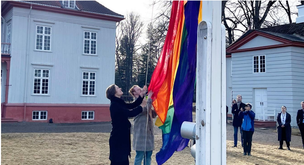
Regnbueflagget ble heist på Eidsvoll 1814 av kunnskapsminister Anette Trettebergstuen.