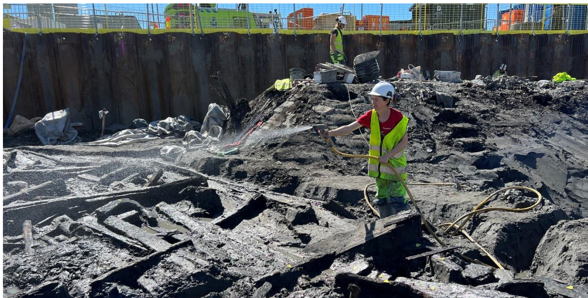
Fleire båter ble funnet under utgravningene i Bispevika i 2022.