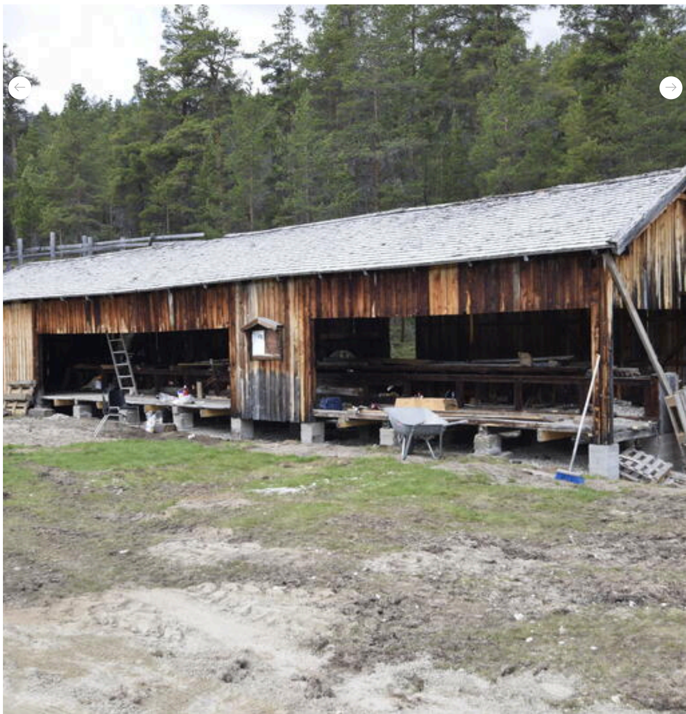
Vassaga i Follidalen.

I 2022 har vi også i samarbeid med Tynset Historie og Museums lag tatt inn et lekehus i samlingen. Lekehuset har vært i privat eie og står i Aumliveien på Tynset.