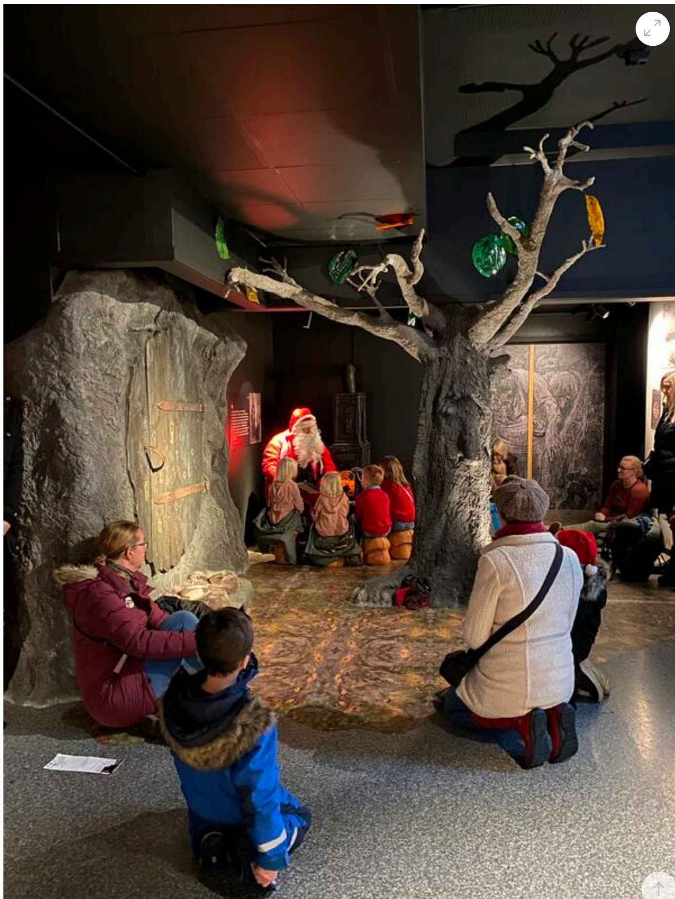
Nissen i eventyrkroken på Kongsvinger museum.