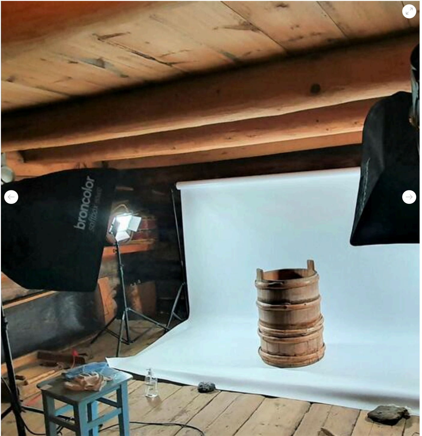
Gjenstandsfotografering i revisjonsprosjektet.