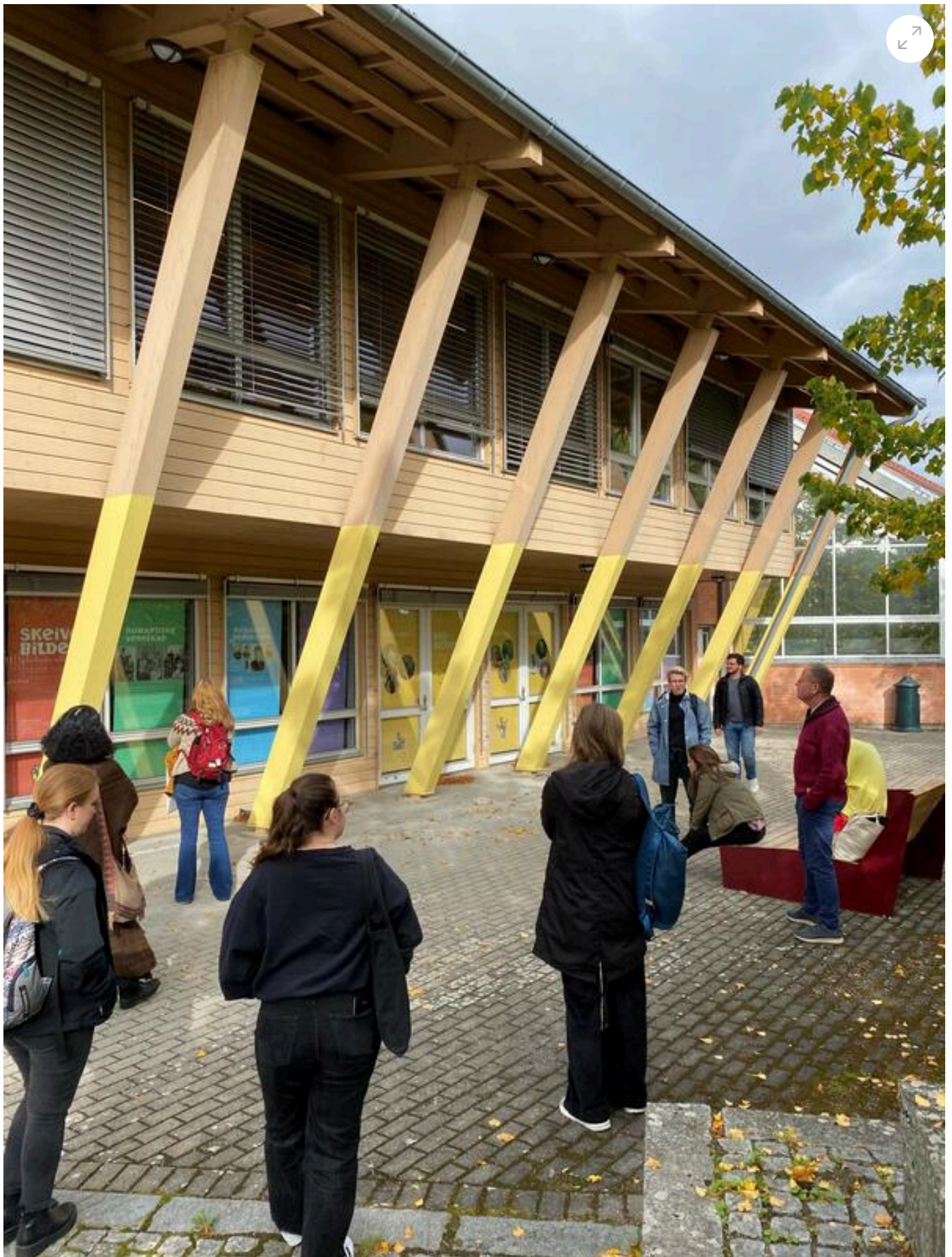
Masterstudenter på omvisning i utstillingen Skeive bilder.