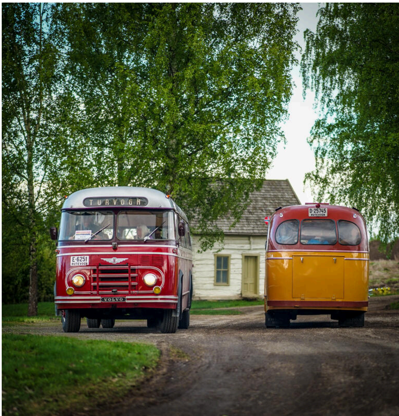
To veteranbusser i friluftsmuseet.