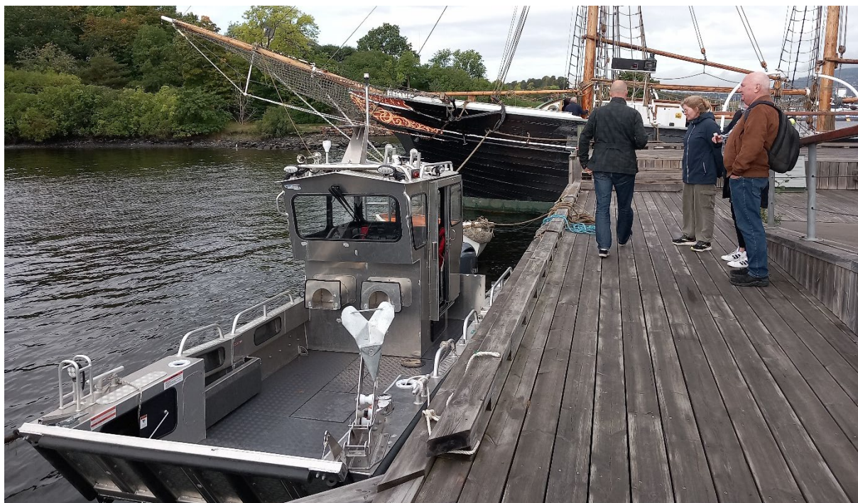
Ny og større dykkerbåt kom til Norsk Maritimt Museum i september.

også på nasjonalt nivå. Ekstra gledeleg var det at driftsløyvinga vart gjort fast i statsbudsjettet for 2024, og slik gav grunnlaget for vidare utvikling av tilbodet ved Ibsen Museum & Teater.