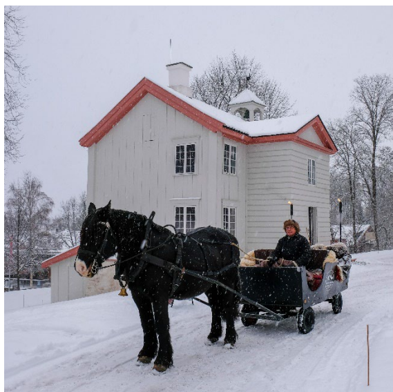
Jul på Eidsvoll

Besøkstillene er i god retning på vei mot før-pandemi-nivå. På grunn av nedstengning av Wergelands hus (byggeperiode) ble besøket i siste del av året noe amputert, men vi tror nyhetsverdien av ny hovedutstilling vil sikre bedre besøk i 2024 enn før pandemien.