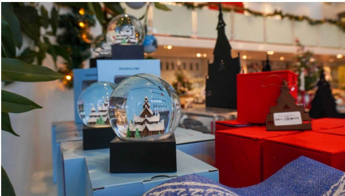
Butikken på Folkemuseet.