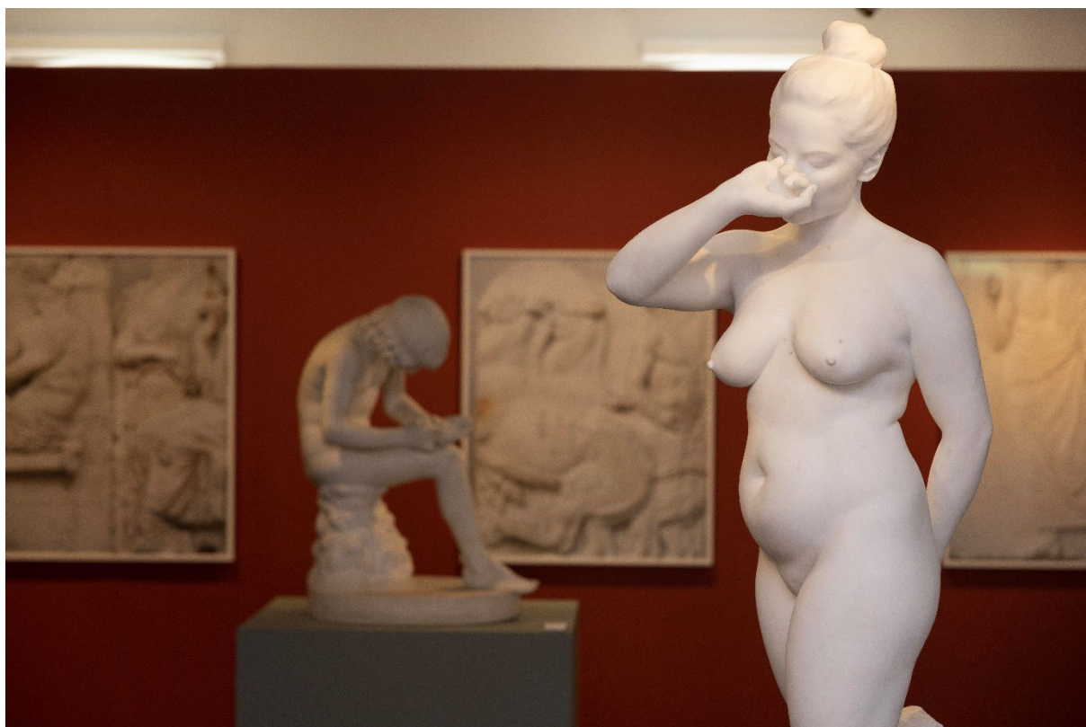
Galleri Østfløyen åpnet sin andre utstilling - «Marmorvariasjoner»