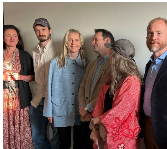
Kunstnerne representert i utstillingen Marmorvariasjoner

Bogstad Gård fortsatte i 2023 å være et levende, aktivt og dynamisk herregårdsmuseum med et tilgjengelig og bredt formidlingsprogram og bærekraftig forvaltning som vi er stolte av.