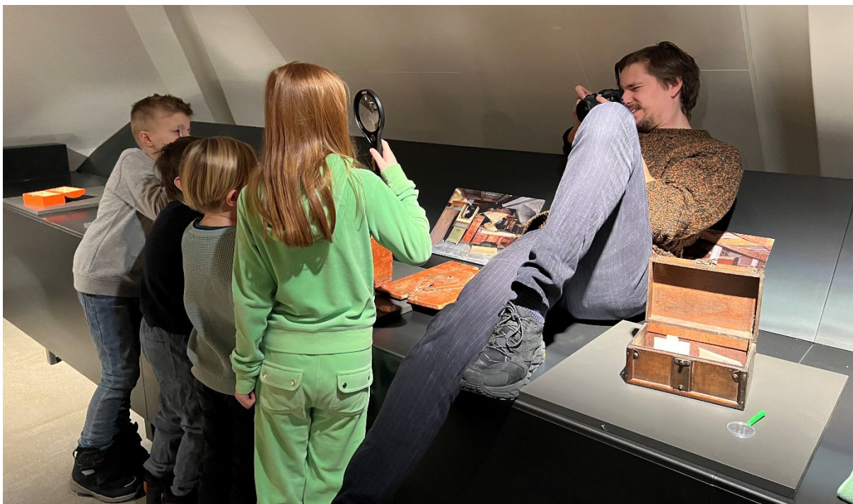
Fotograf Christian André Strand på oppdrag for kommunikasjonsavdelingen. Foto: Anniken Mihle