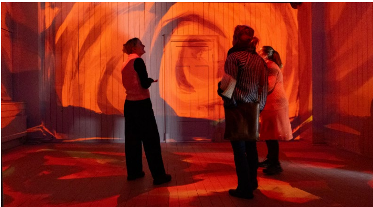
Ibsen Museum & Teater kunne endelig åpne for publikum i juli.