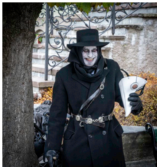
Besøksrekord på Halloween.

Museet arbeider kontinuerlig med kunnskapsutvikling, og deltar i flere museumsnettverk: Herregårdsnettverket, Mangfoldsnettverket, Samisk museumslag og Bygningsvern.