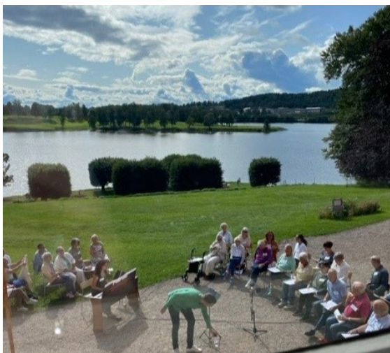
Demenskoret under innspilling på Bogstad

En kombinasjon av den nye benet å stå på, Galleri Østfløyen, et omfattende arrangements- og omvisningsprogram, og ikke minst store og bredt anlagte publikumsarrangementer gjør at egeninntekter og billettinntekter skyter i været.