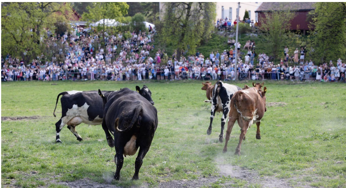
Lykkelige kuer og glade publikummere på kuslippet i mai.