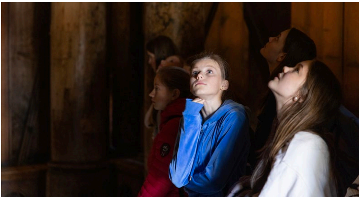
Skoleklasse på besøk i Stavkirken på Folkemuseet.