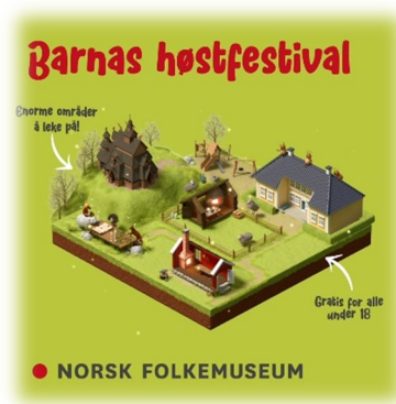
Kampanjen «Hva skal vi gjøre...» ble laget sammen med Metro for NMM og NF.