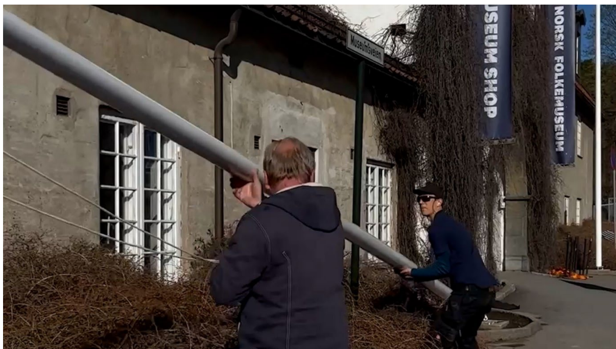
Nye flaggstenger settes på plass utenfor inngangen til Norsk Folkemuseum i april.