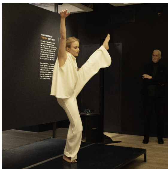
Boklansering av Tidsrom.

Gjennom året har rundt 25 000 barn og unge benyttet seg av museets undervisningstilbud. Her møter elevene engasjerte og faglig dyktige omvisere som tilpasser omvisningen til gruppen og gjør museet levende og relevant. Med den nye læreplanen har spesielt omvisningene med Samisk og kvensk tema vært populære. Nytt av året var Verkstedet, en aktivitetssone på museet særlig rettet mot barn og unge som åpnet under Halloween.