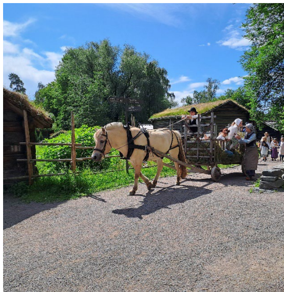
Landbrukstunvertene på Folkemuseet

I 2023 ble det etablert en del ulovlige bøyeplasser i Frognerkilen mellom Thulstrup- og Oscarshall-bryggen. Det har blitt arbeidet med å begrense adgangen til å legge fra seg joller og Bymiljøetaten ryddet bort flere vrak.