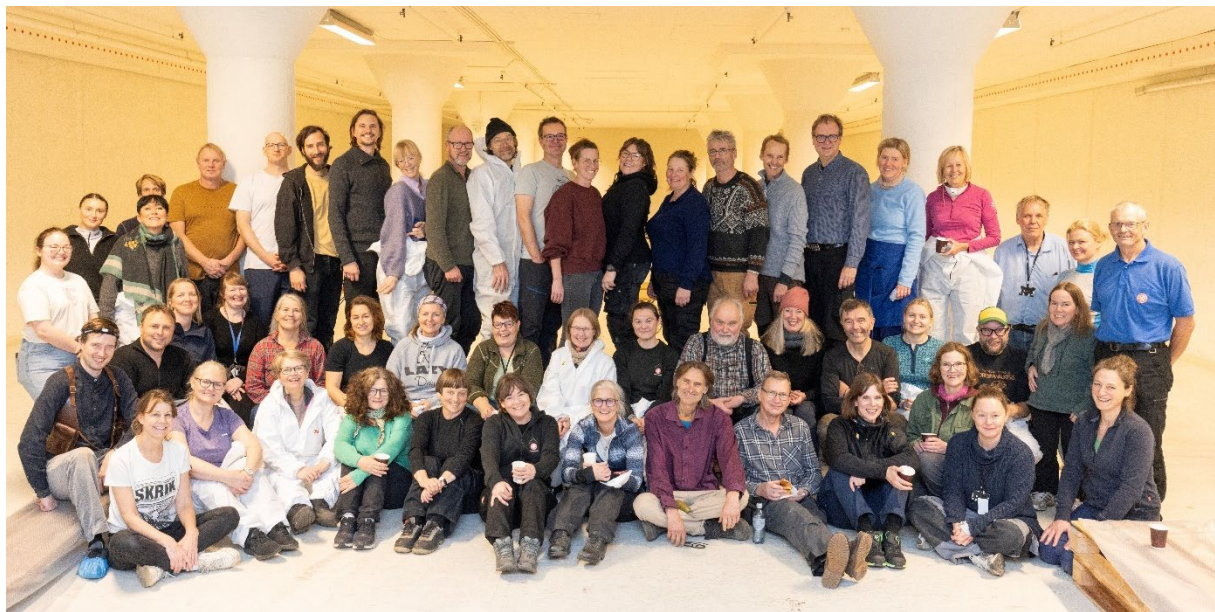
Ansatte fra hele Stiftelsen har bidratt til flytting av magasin. Her er dugnadsgjengen i Ekeberg 26. oktober.