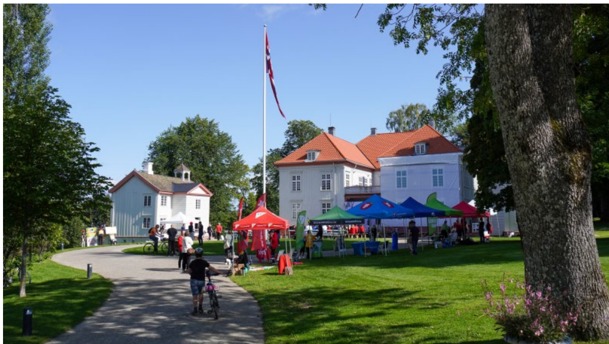
Demokratiets dag på Eidsvoll