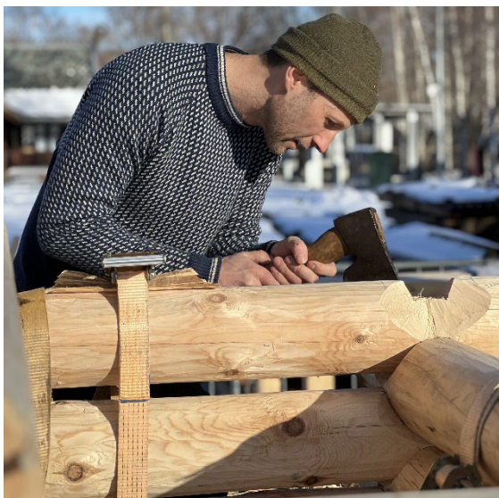
Trappesfestivalen 2023.