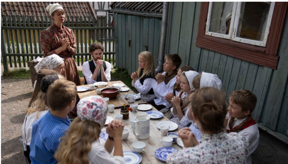
Historisk ferieskole.