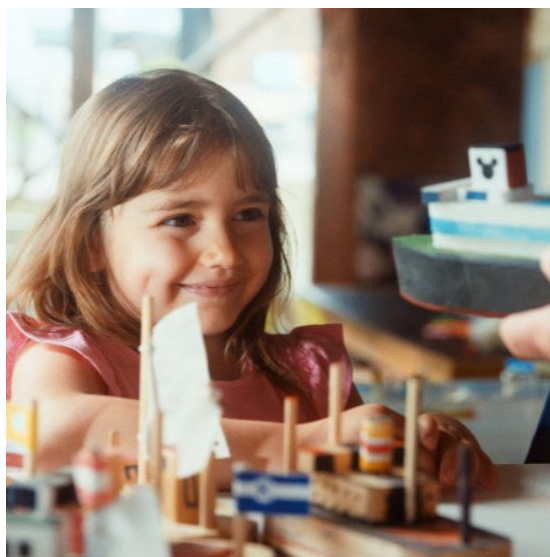
Barnas båtverksted er et populært søndagstilbud