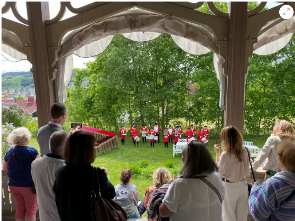
Drum ladies i hagen på Kvinnemuseet.

Avdelingens prioriteringer og aktiviteter følger Anno museums Strategiske plan samt Kulturstrategi for Innlandet.