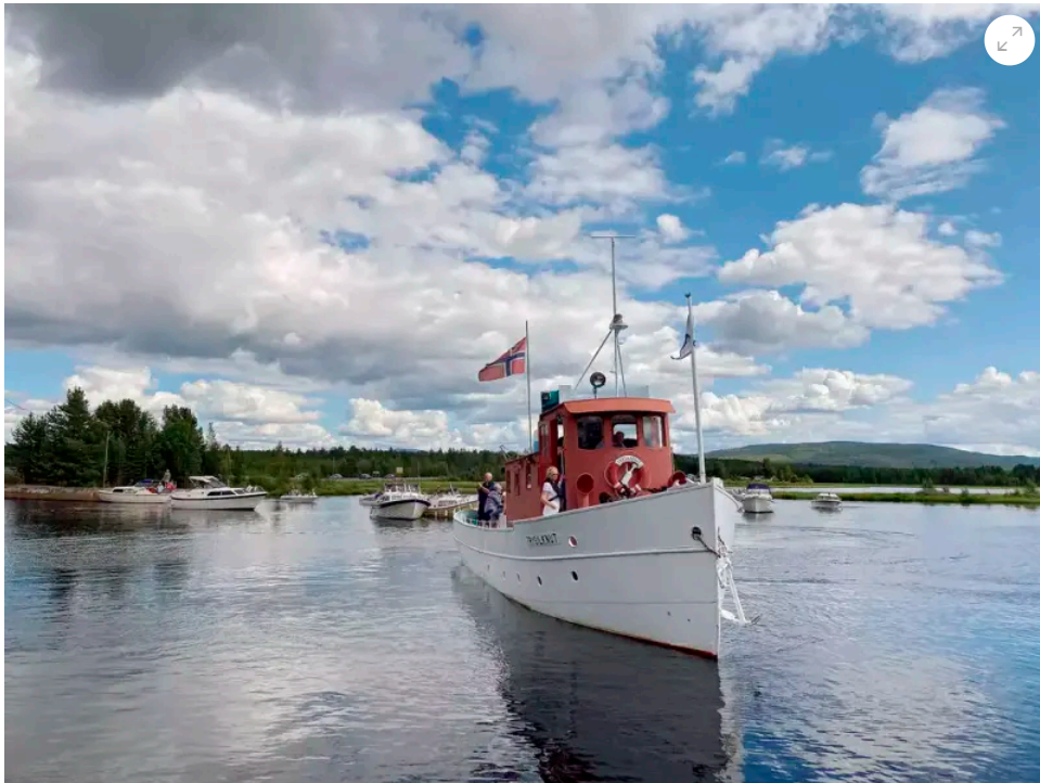
Slepebåten Trysilknut på Osensjøen.