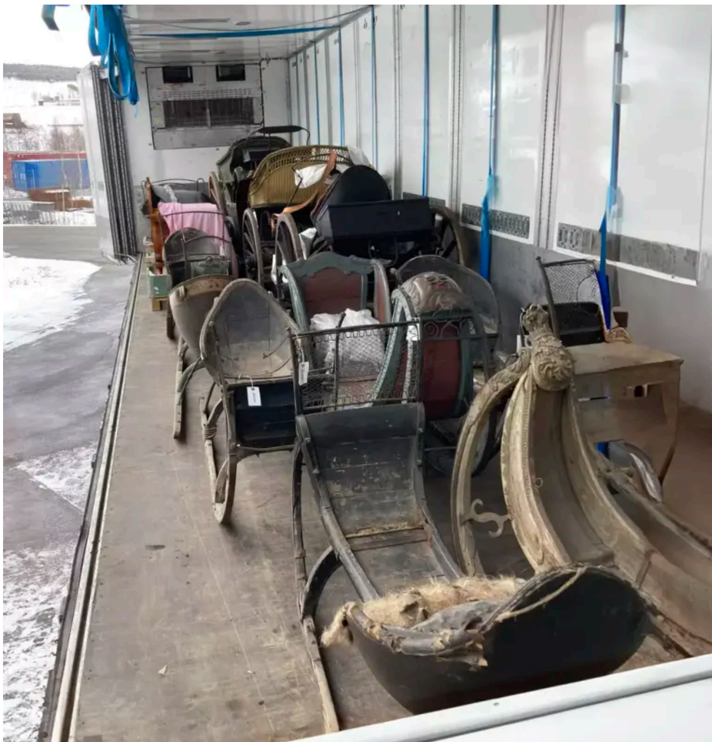
Sleder lastet på lastebil for flytting til Anno bevaringssenter.