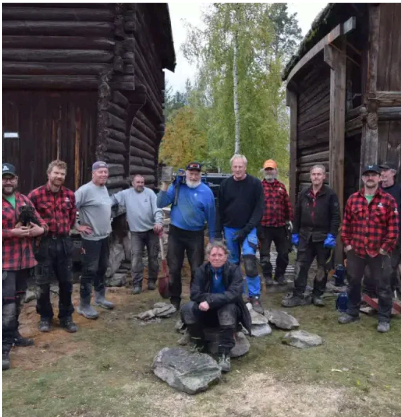
Fra bygningsverngruppa sin samling i Museumsparken på Tynset. De antikvariske håndverkerne har masse kompetanse om byggeskikk og tradisjonshandverk.