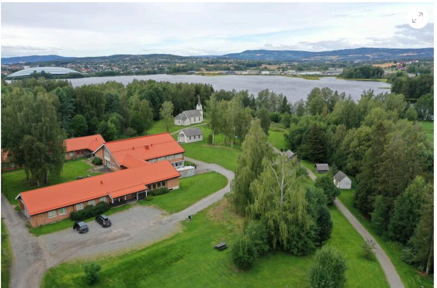
Norsk utvandremuseum sett fra lufta