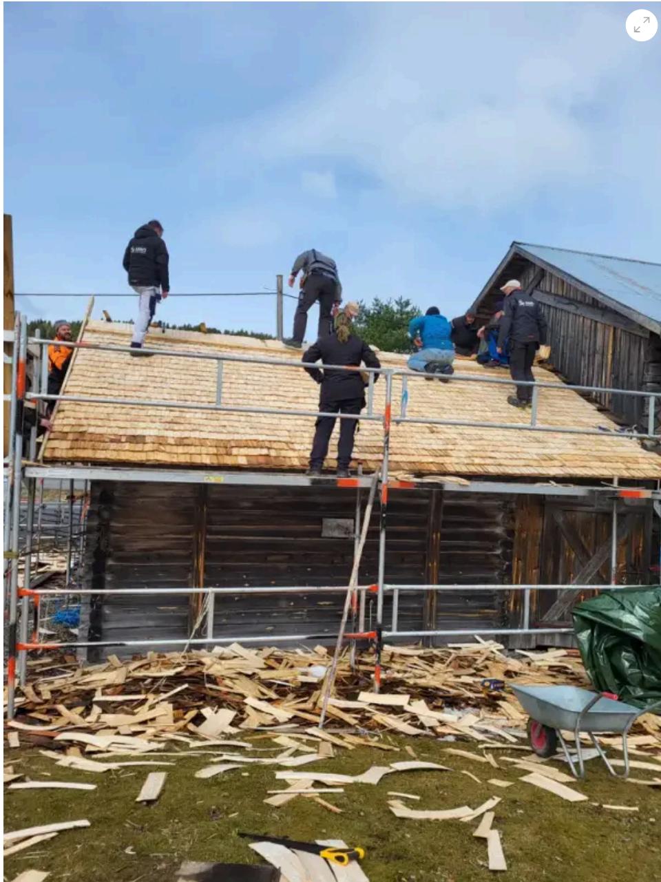
Nytt sticketak legges på utstillingslåven på Almenninga, Eidskog museum.

museum i september, og interessen for tjenesten har vært stor – både under arrangementet og ellers har vært stor. Mange har tatt kontakt med ønske om bistand til ulike restaureringstiltak i regionen.