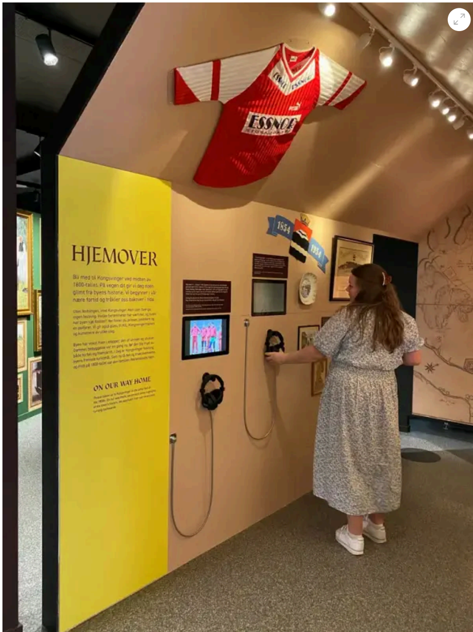
"Hjemover" - prologen til utstillingen Hjemland på Kongsvinger museum.