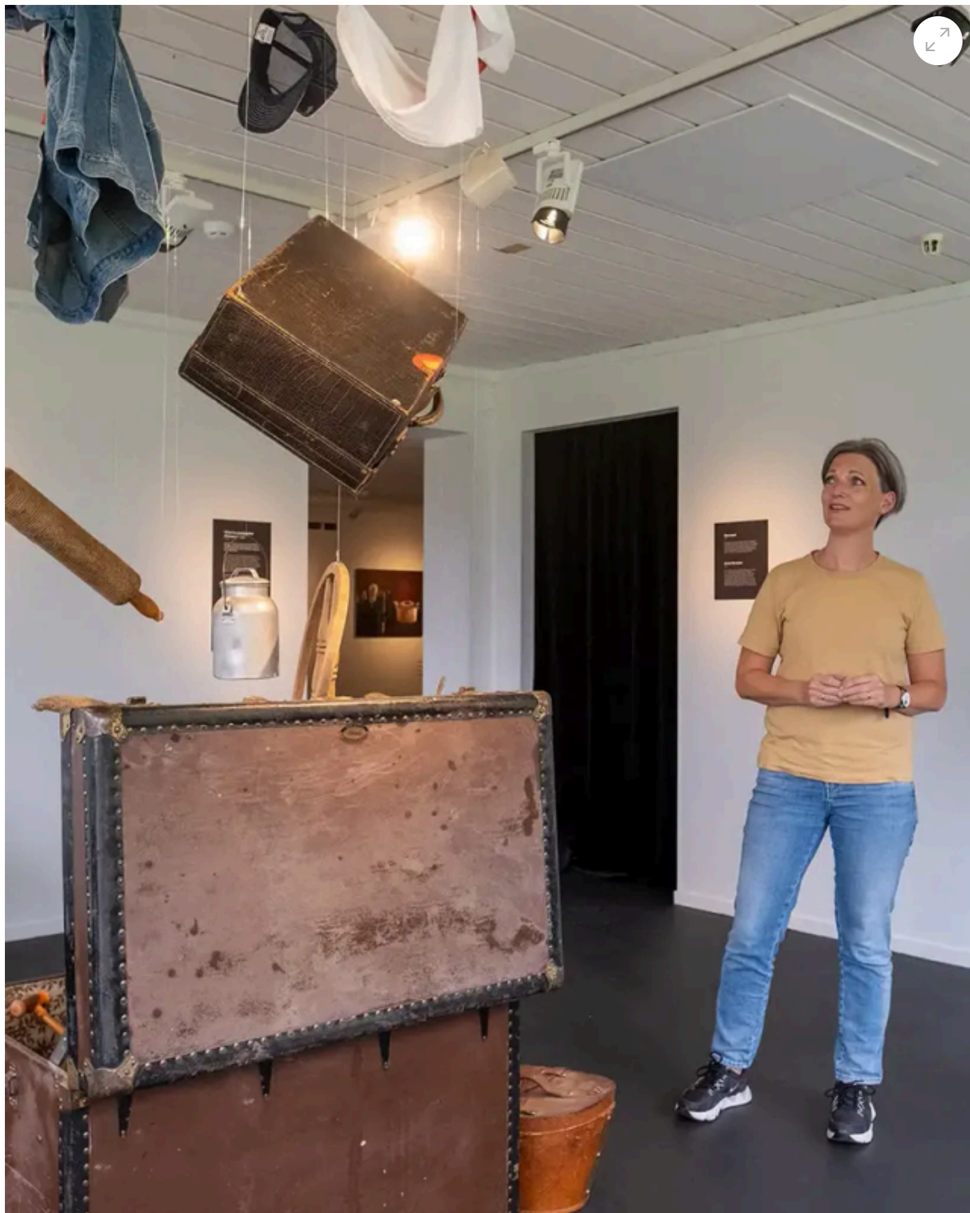
Opphavstegn utstillingen på utvandremuseet i Hamar

Museet har gjennom 2024 dialog med utbyggerne av Kåterudjordet for å følge opp reguleringsplanens bestemmelser. Samhandlingen med Stange kommune ble gjennomgått i et eget møte med Stange kommune ved ordfører og kultursjef.