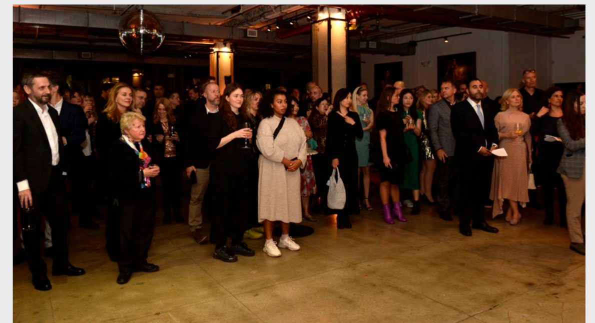
Soho House, NYC

Sammen med de fem regionale filmkommisjonene og andre nordiske kollegaer har Den Nasjonale Filmkommisjonen signert et bærekraftløfte, og i 2024 skal vi jobbe videre med organisasjonens bærekraftstrategi.