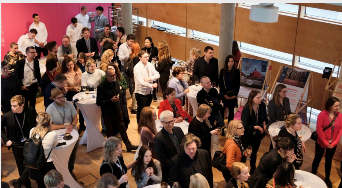
The Nordic Embassies in Berlin

Organisasjonen jobber også aktivt for å fremme Norge gjennom å delta i relevante paneler, og i 2023 stilte vi i flere paneler i regionale, nasjonale og internasjonale fora. Tematikken vi blir spurt om å diskutere spenner fra Norge som destinasjon for filmproduksjon, bærekraft i den internasjonale filmindustrien, filmturisme og næringsutvikling i regionene.